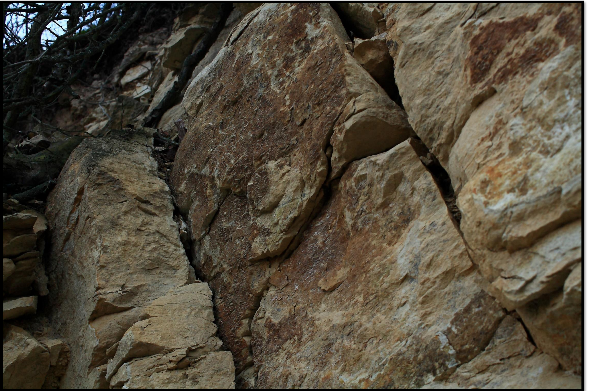
Fosilie amonita – pohled z boku