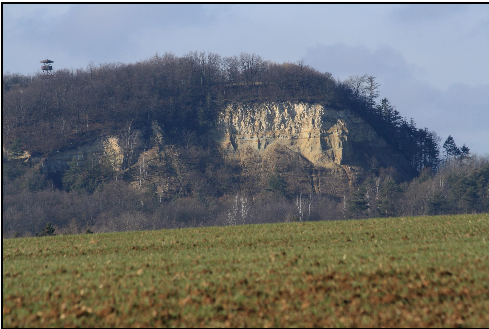
Bližší pohled na východní stranu svědecké hory Malý Chlum s rozhlednou a lomem