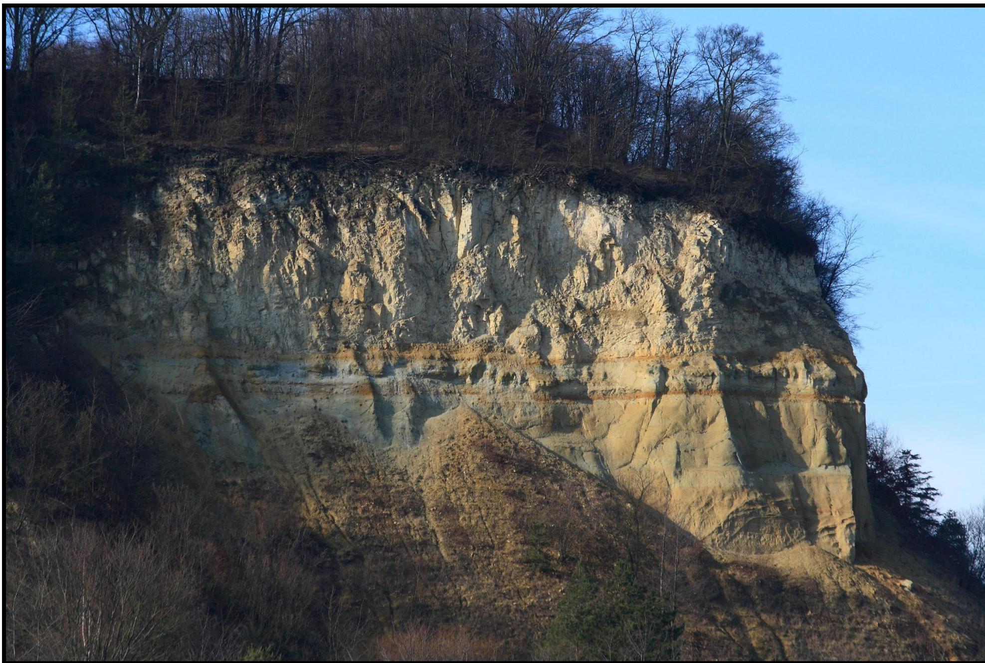
Pohled na stěnu lomu s výrazným souvrstvím sedimentů svrchní křídy