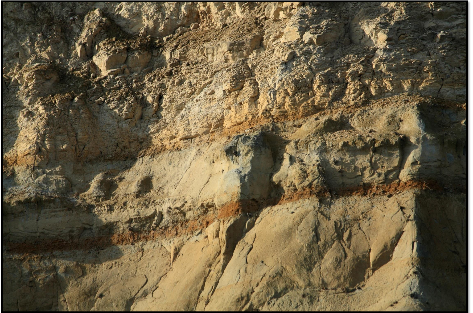
Rudé proužky železitého pískovce