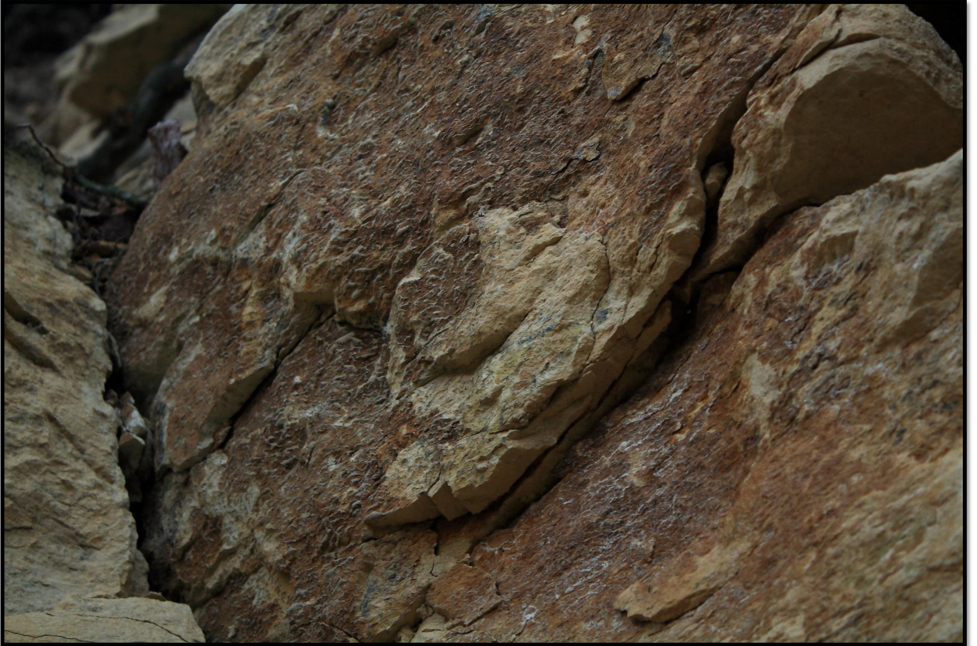
Fosilie amonita – detail