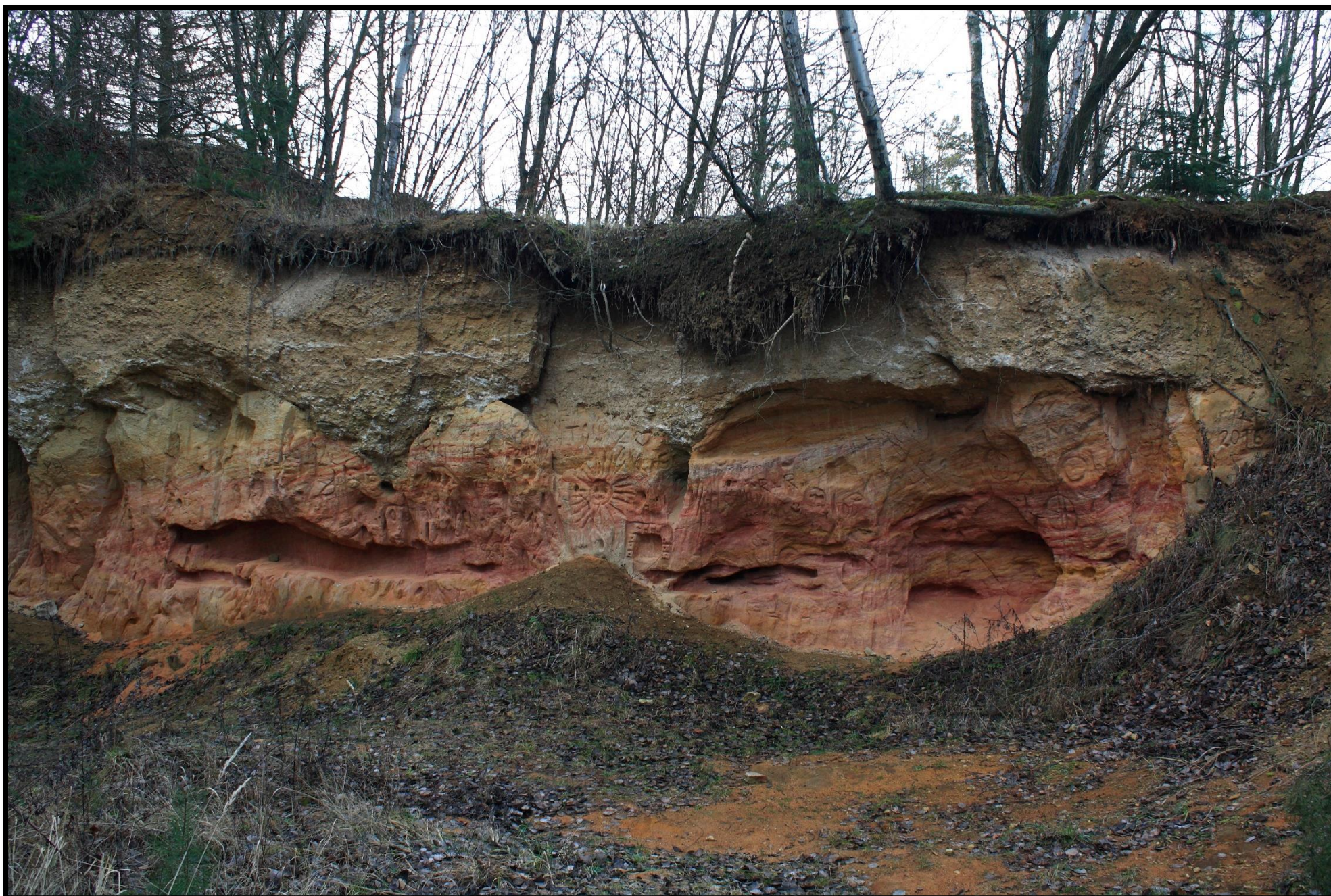
Barevné vrstvy křemenných pískovců – červené vrstvy obsahují železo