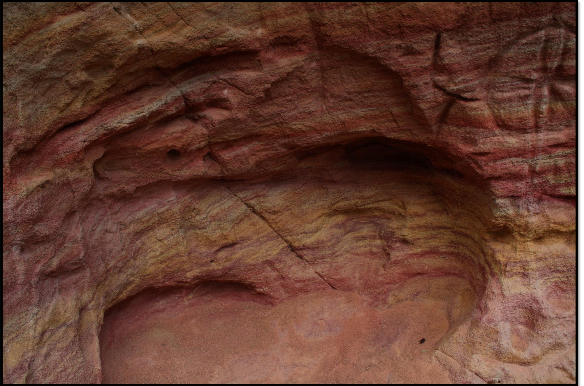
Barevné souvrství křemenných pískovců s vrstvičkami silně železitých pískovců