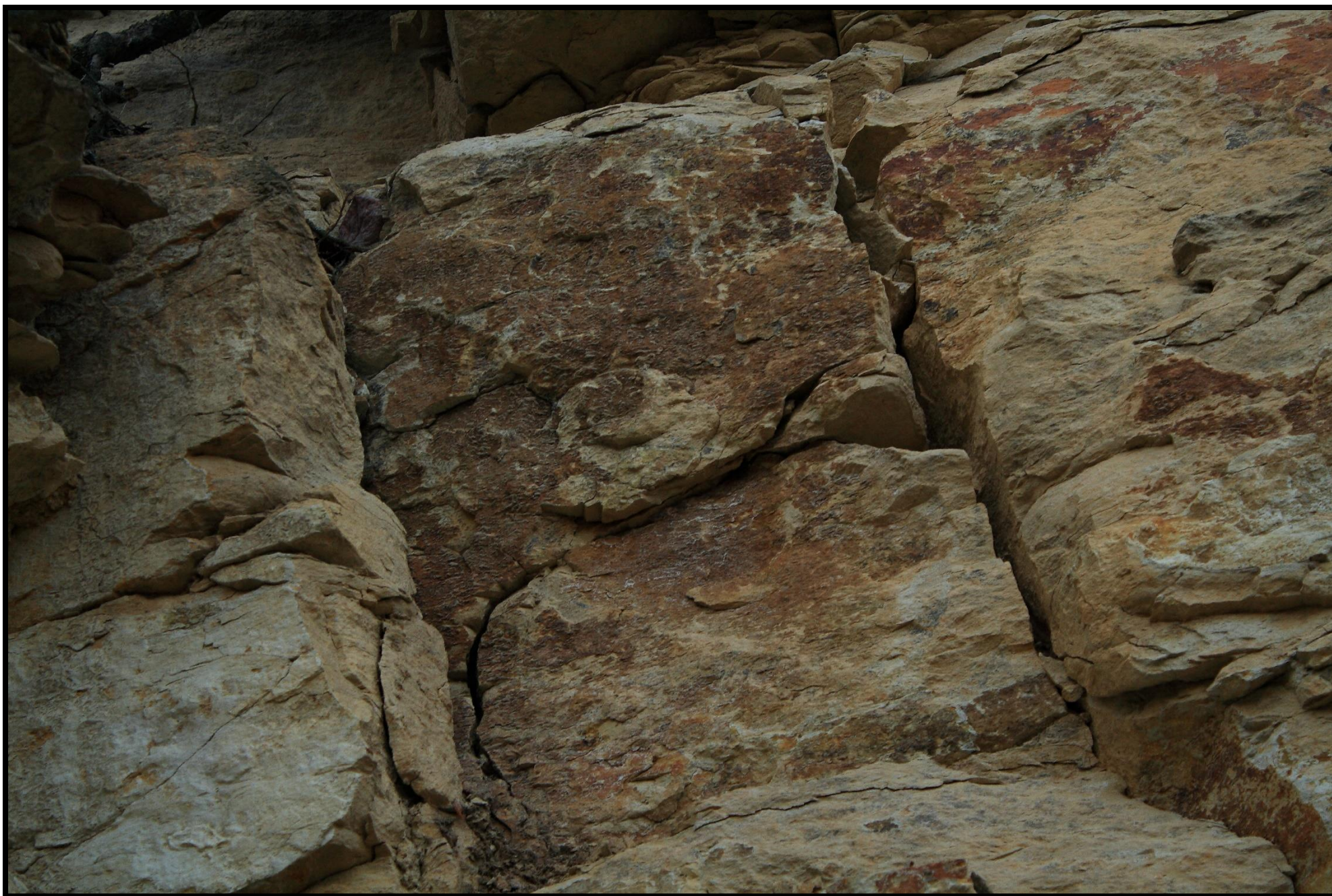
Fosilie amonita v opukové skalní stěně