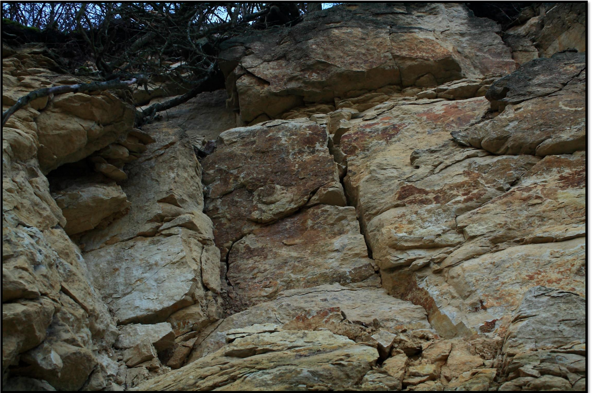
Fosilie amonita – pohled na skalní stěnu