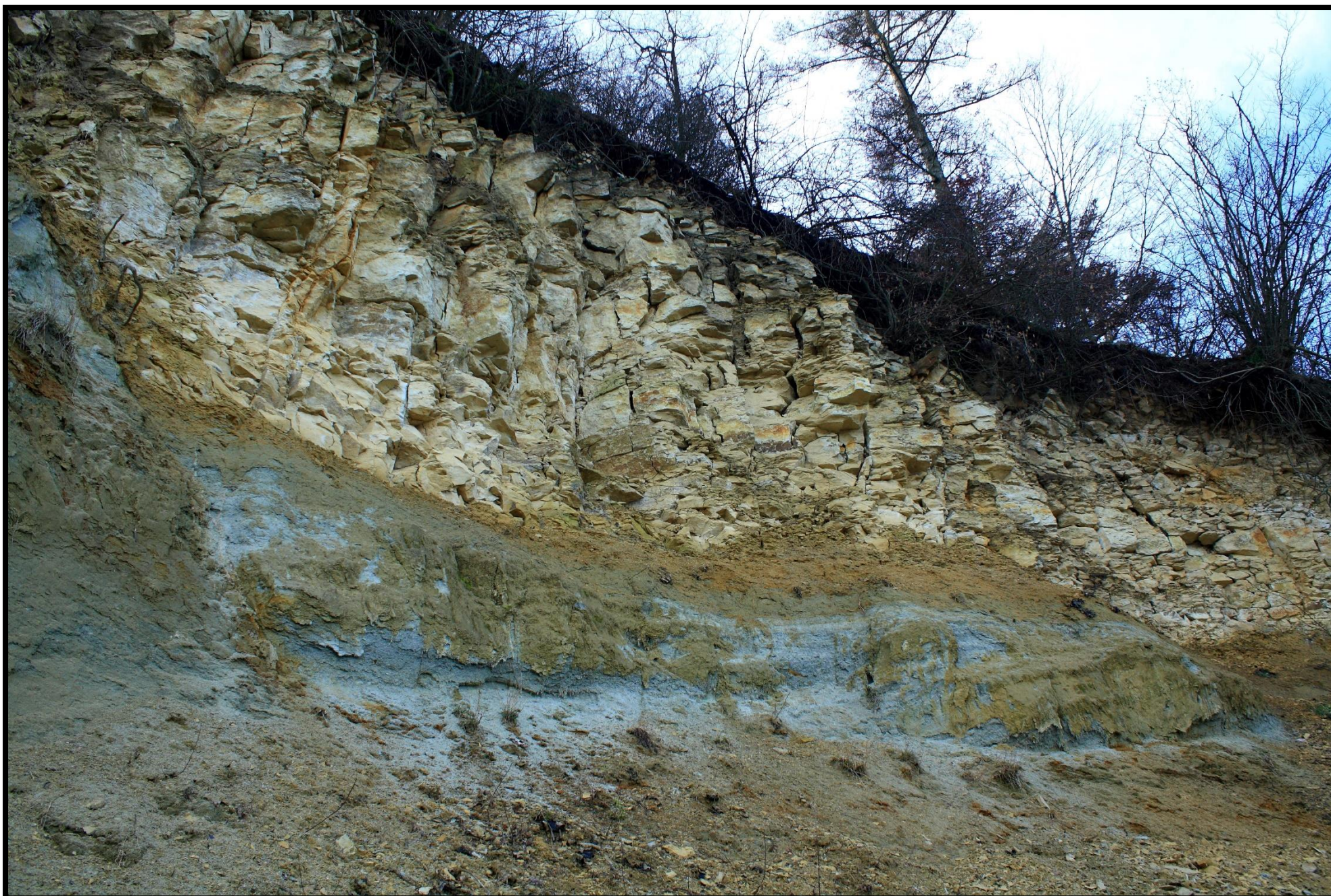
Na šedé glaukonitické pískovce ostře nasedají žluté lámavé opuky - vápenné spongolitické prachovce a slínovce.