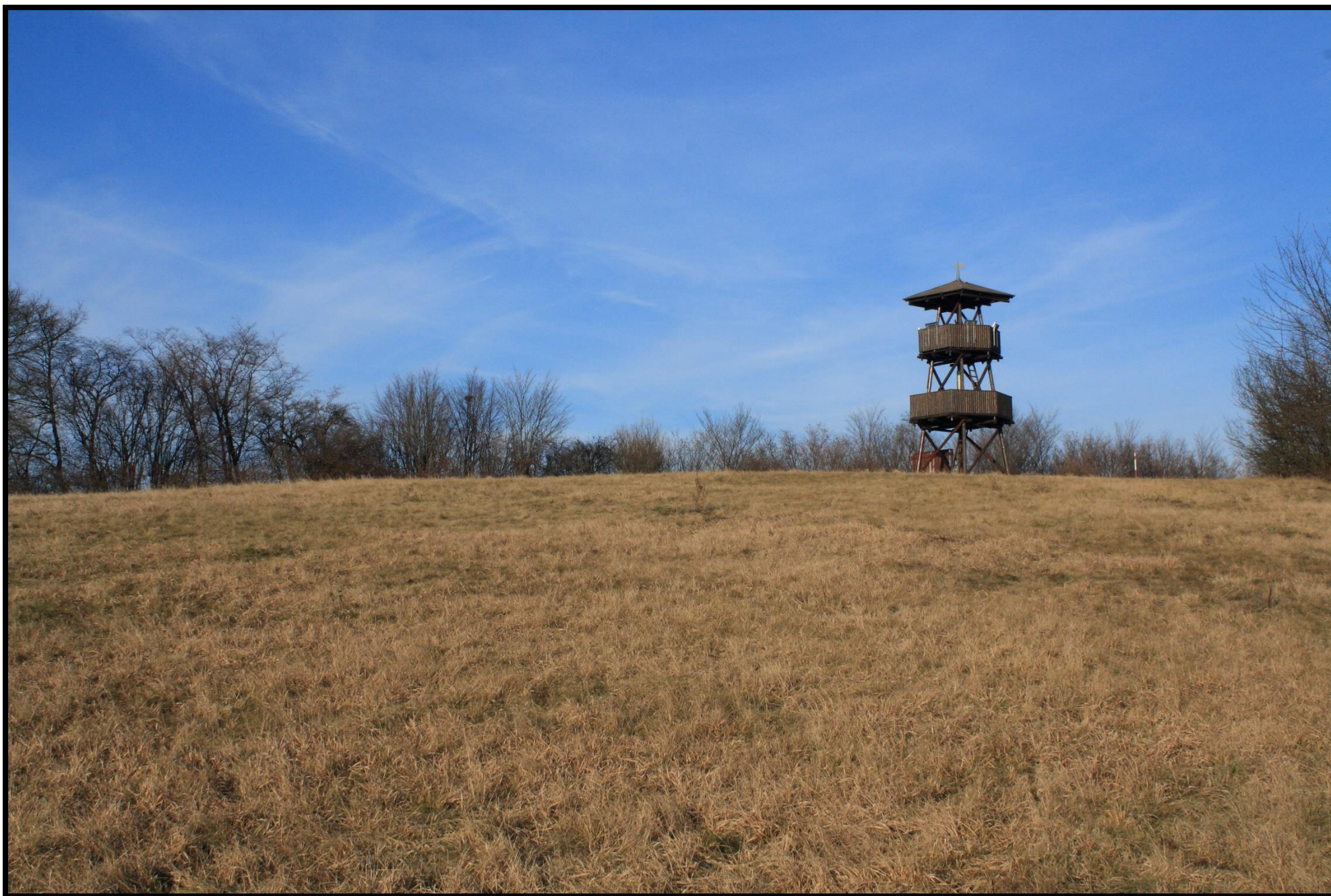
Vrcholová travnatá plošina Malého Chlumu – zde bylo v době halštatské hradisko (6. století př.n.l.)